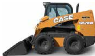
MINIPALE COMPATTE GOMMATE