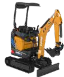
ESCAVATORI CINGOLATI MINI