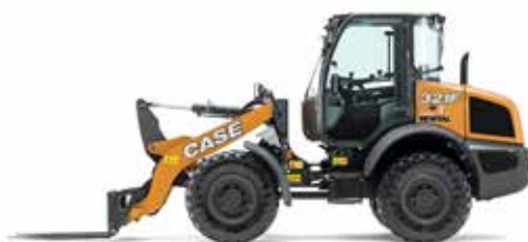
PALE GOMMATE COMPATTE