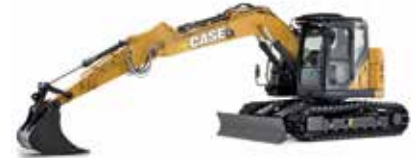
ESCAVATORI CINGOLATI SR