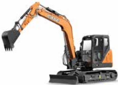
ESCAVATORI CINGOLATI MIDI