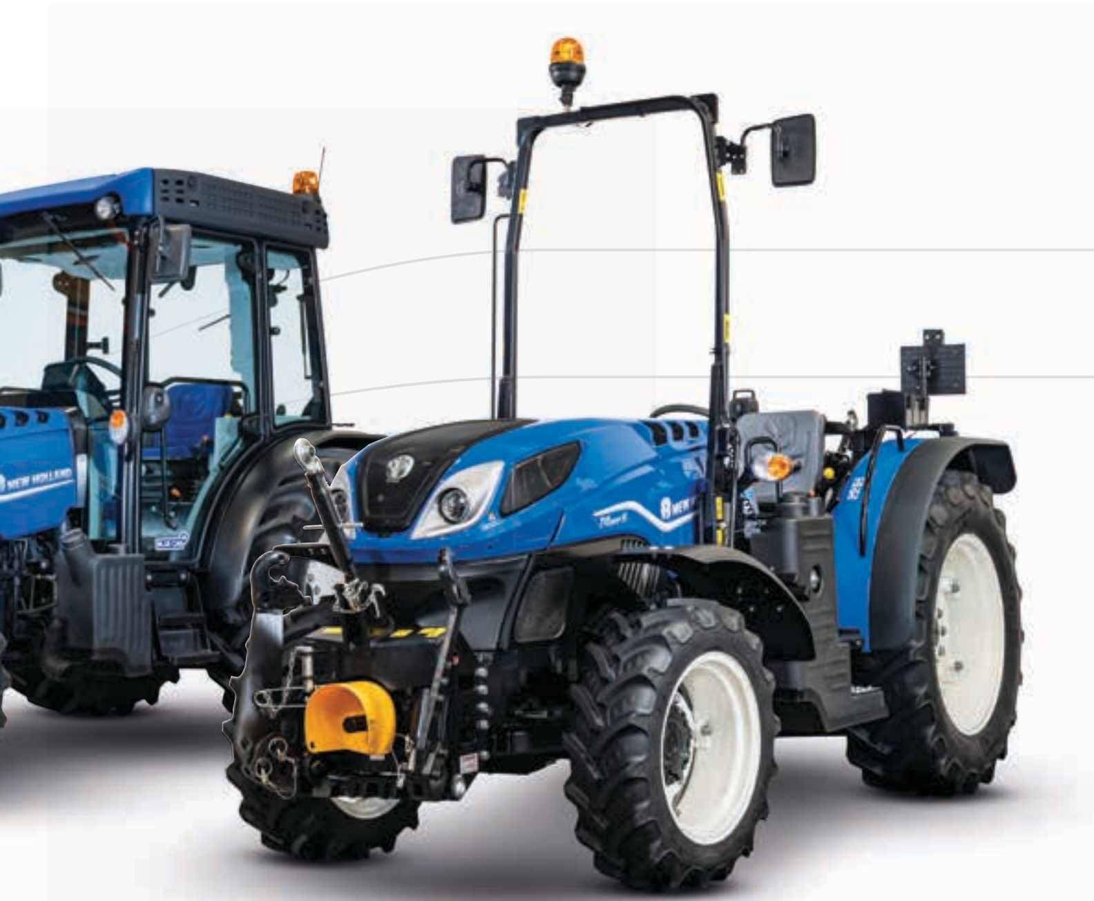
Grote hydraulische capaciteiten Zie pagina 10