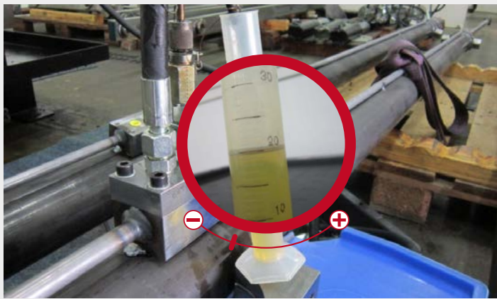
Interner und externer Leckagetest.

Jeder Original-Hydraulikzylinder ist so konstruiert, dass er perfekt zu Ihrer Maschine passt.