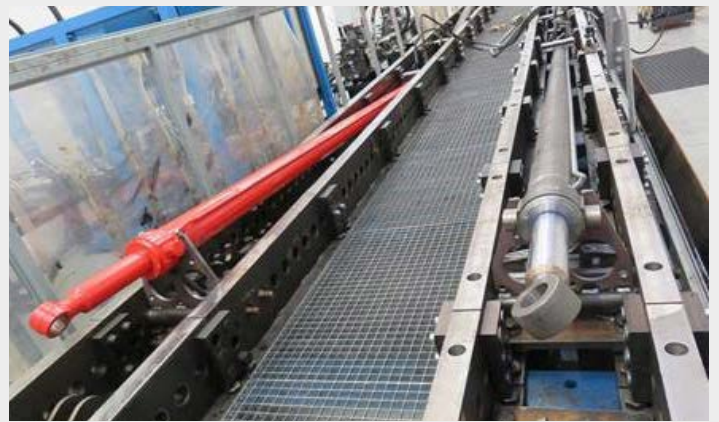
Vergleichstest zwischen Original-Ersatzteilen und Ersatzteilen von Wettbewerbern.