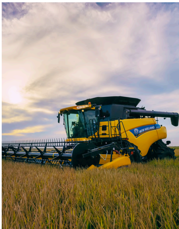
LINEA CR & CR INTELLISENSE