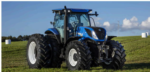
SERIES T5 S, T7, T8 Y T9