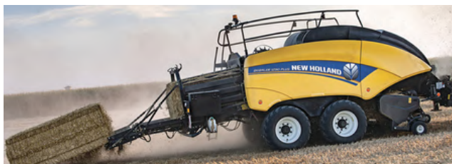
LÍNEA BIG BALLER