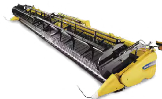
800 CF DRAPER HEAD