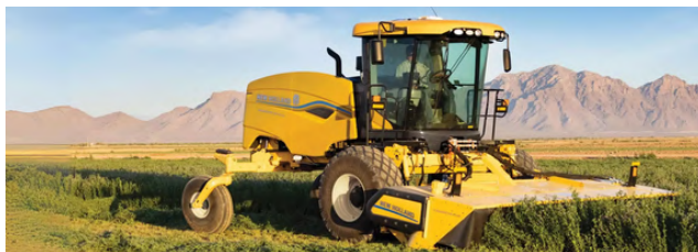
SEGADORA SR200 PLUS