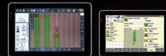
CASE IH PRO 1200*