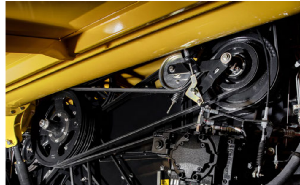
MÁQUINA COM CONFIGURAÇÃO DE QUALIDADE DE GRÃOS

Outra mudança importante na servicibilidade da máquina é o côncavo de debulha seccionado. O côncavo do cilindro é dividido em três seções, das quais duas podem ser trocadas individualmente para adaptar a máquina para a colheita de grãos finos ou graúdos. A troca destes côncavos também foi facilitada e agora pode ser feita através de uma abertura que fica abaixo do alimentador da máquina.