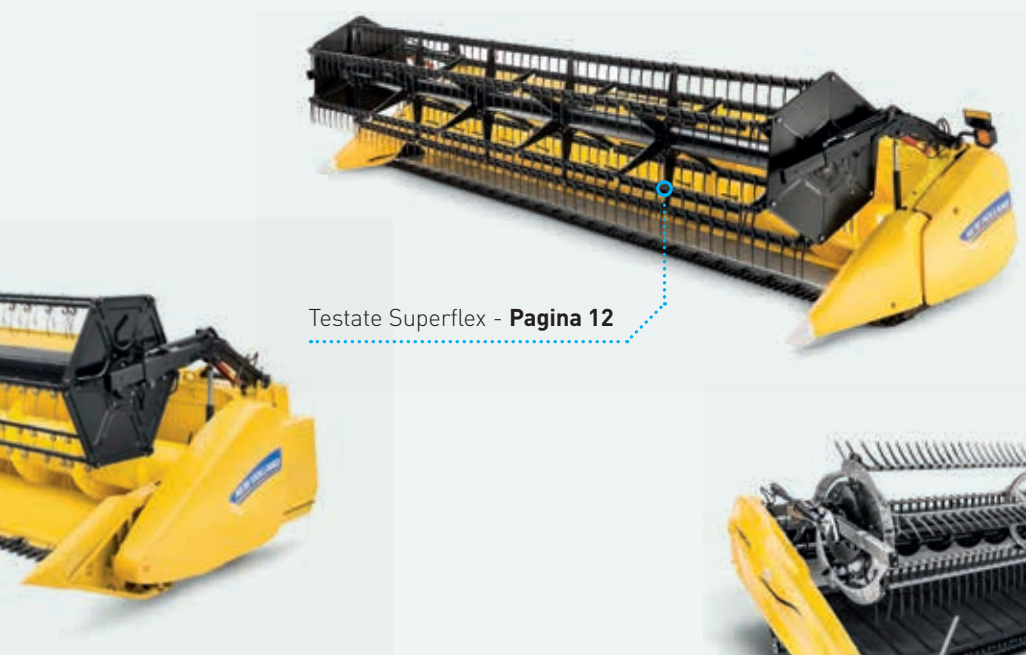
Testate Superflex - Pagina 12

New Holland offre una testata per ogni tipo di prodotto: piccoli cereali, colza, mais, soia, lino, fagioli, graminacee, trifoglio, miglio e riso, oltre a molte altre colture emergenti o tradizionali. Sia che lavoriate su terreni ondulati o su grandi distese pianeggianti, una testata New Holland sarà sempre in grado di assicurarvi prestazioni al top. In tutti i campi. Con tutti i prodotti. Ovunque.