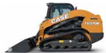
CARGADORAS COMPACTAS DE CADENAS