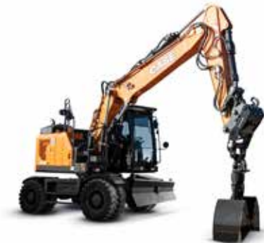
EXCAVADORAS DE RUEDAS