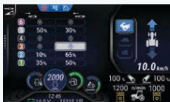
Configurazione dei distributori ausiliari elettroidraulici

Dalla schermata principale si accede facilmente a 8 sottomenu per regolare funzionalità come portata dell'olio idraulico, automatismi della presa di potenza, dimensioni dell'attrezzo, gestione del sistema Blue Cab™ 4... Grazie al suo design ed ergonomia, questo schermo mantiene inalterata la perfetta visibilità verso l'esterno della cabina.