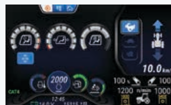
Gestione del sistema di filtrazione di categoria 4