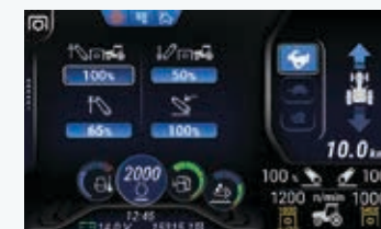
Controllo elettronico dello sforzo