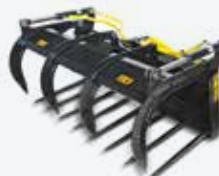
Grappin à fumier Heavy duty