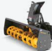
Souffleuse à neige