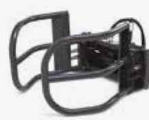
Pince à balles