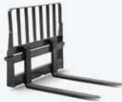
Fourche à palettes