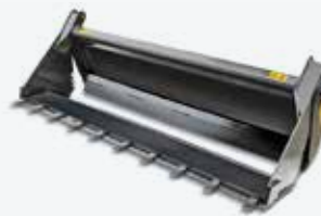
Godet 4 en 1