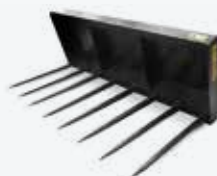
Fourche à fumier