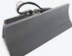
Lame à neige