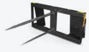
Pique à balles