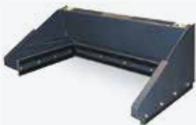
Racloir à lisier