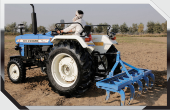
कल्टीवेटर - 9 टाइन