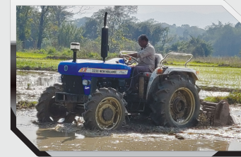
पडलिंग - 4WD ट्रैक्टर के साथ रोटवेटर