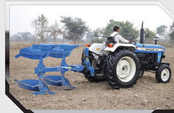
रिवर्सबल फ्लॉ - 2 बॉटम