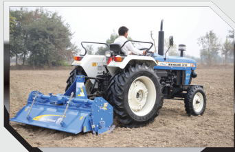
रोटावेटर 6 फुट